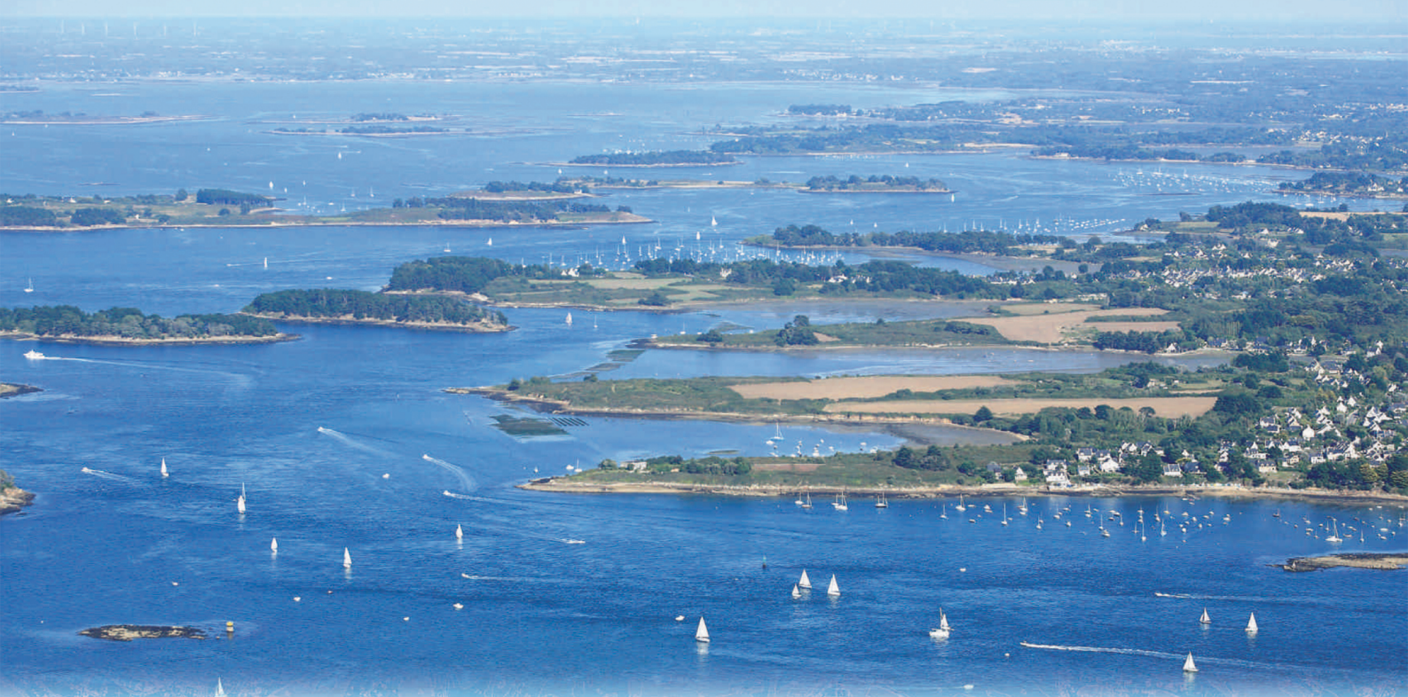
Schéma de mise en valeur de la mer Golfe du Morbihan